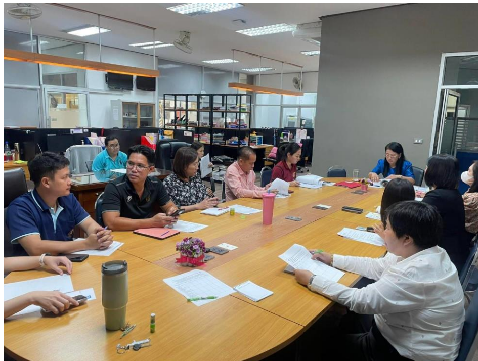
ภาพประกอบการประชุมคณะกรรมการดำเนินงานการจัดการความรู้ เพื่อจัดทำแผนการดำเนินงานการจัดการความรู้ (KM) เมื่อวันที่ 6 ธันวาคม 2566 ณ สำนักวิทยบริการ มหาวิทยาลัยนครพนม